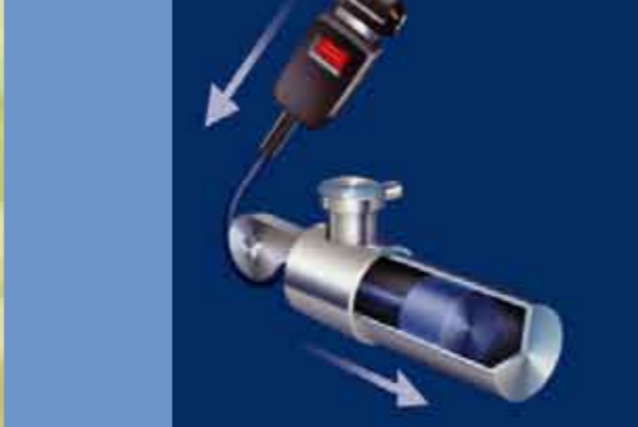
Předpínače bezpečnostních pásů v případě havárie bleskově přitáhnou tělo pasažéra do sedačky.