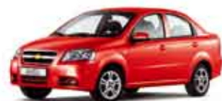
Červená Super pastelová