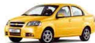
Žlutá Highway pastelová