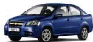
Modrá Sports mica