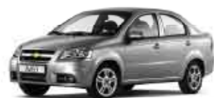
Stříbrná Poly metalická