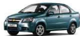
Modrozelená Fayence metalická