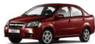
Červená Flame mica