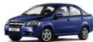
Modrá Impression metalická