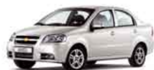
Bílá Galaxy pastelová