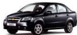
Černá Carbon metalická