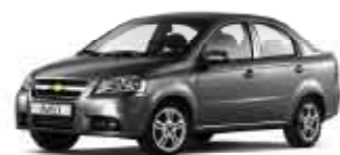
Šedá Urban metalická